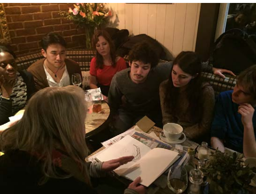
2016 - Cambridge, UK