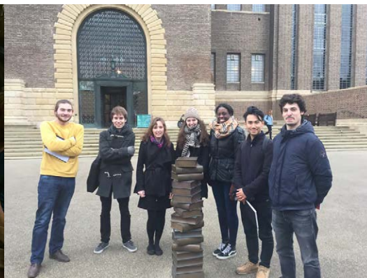
2016 - Cambridge, UK