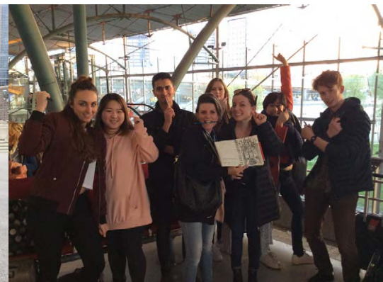
2017 - Lille, France